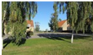
Kig fra Sygehusvej ind i området

Området er beliggende ovenfor istidsskrænten, og har dermed en attraktiv beliggenhed med gode udsigtsmuligheder. Det skal sikres, at der fra Sygehusvej fortsat er udsigtskig ud over byen, fjordlandskabet og fjorden.