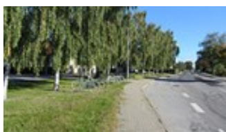
I området findes en del større birketræer - her langs Sygehusvej

Eksisterende beplantning skal i videst muligt omfang bevares.