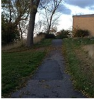
Over Sønderbakken forløber på toppen af istidsskrænten.

Stiforbindelsen Over Sønderbakken, der forløber langs istidsskræntens kant bag sundhedscentret, skal sikres, da den er en vigtig del af det sammenhængende stinet i byen.