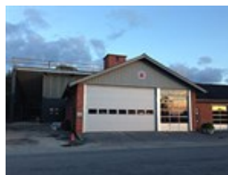
Opførelse af ny brandstation

På sigt kunne der åbnes op for en boligudbygning langs Søndergade i området.