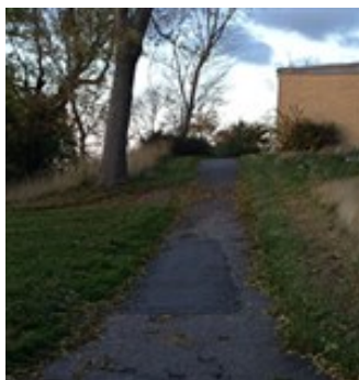
Stiforbindelsen Over Sønderbakken

Stiforbindelsen Over Sønderbakken, der forløber langs istidsskræntens kant skal sikres, da den er en vigtig del af det sammenhængende stinet i byen.