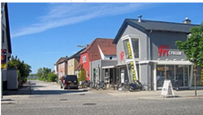
Der bør stadig være fokus på det visuelle miljø langs med Thistedvej.

Langs Thistedvej er bebyggelsens karakter mere blandet. Fine små forstads- og landevejshuse, hvor mange er sat pænt i stand, udgør en væsentlig del af bybilledet og er et bevaringsværdigt træk, som skal respekteres ved indpasning af nybyggeri. Randbebyggelsen omfatter endvidere butiks- og servicefunktioner samt indslag af nybyggeri, fx ved nærbanestationen. I den forbindelse bør der fortsat ske en indsats for at forbedre områdets visuelle karakter, da en del skilte og facader forstyrrer bybilledet.