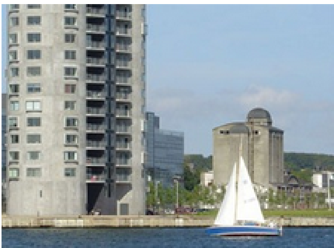
Industribaggrunden er med til at give DAC-området sin egen identitet.

kajkanten bibeholdes som et landemærke på den nordvestlige havnefront.