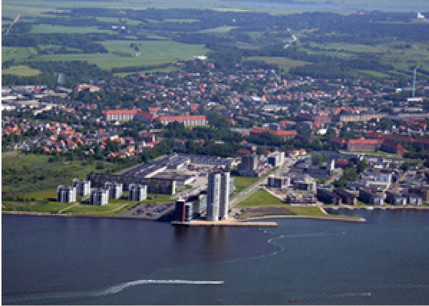
Omdannelsen af Lindholm Brygge er næsten færdig, og området fremtræder som et nyt attraktivt område med store rekreative kvaliteter.

Det tidligere DAC-område er udbygget ud fra ønsket om, at understrege og respektere oprindelige strukturer og udsigtslinjer mod fjorden. Den nye bebyggelse fremtræder som længe- eller punkthuse i et moderne - og ofte maritimt - formsprog. Tilbagestående industribygninger står med deres oprindelige udtryk og er på den vis væsentlige kulturhistoriske træk, som sikrer området sin egen identitet.