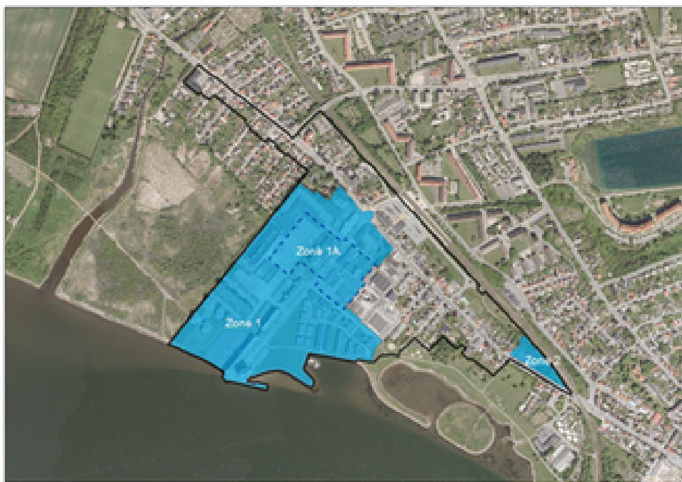
Lufifoto med zoneinddeling

DAC-området (zone 1) er næsten udbygget. Planen for området, som der også fremover skal bygges efter, er overvejende disponeret efter et stramt mønster med bygningerne orienteret vinkelret på fjordkanten. Bebyggelsesplanen sikrer dermed den bedst mulige visuelle kontakt til fjorden fra selve området samt naboområder og er i overensstemmelse med ønsket om, at styrke Aalborgs identitet.