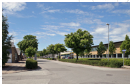
Træerne i hække langs Hjulmagervej er et fint grønt træk i området, der kan inspirere til andre dele af området.

For så vidt angår bebyggelsens udformning skal der sikres et højt arkitektonisk niveau, og når der bygges nyt eller bygges om på arealer, som ligger i tilknytning til kanalen, skal muligheden for at orientere bebyggelsen mod det grønne og med mere "åbne" facader overvejes.