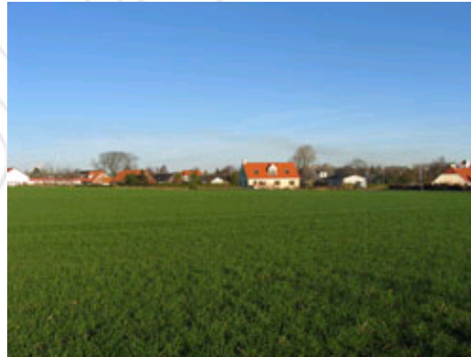
Udsigt mod Sønder Tranders landsby.

Området kan overføres til byzone gennem en lokalplan.