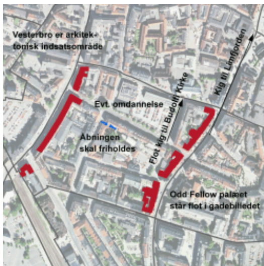
Th.ø. Odd Fellow Palæet markerer sig flot i Boulevardens gadebillede. Th.n. Arealet ved Budolfi Plads er på vej til at blive omdannet med ny bebyggelse, grønne byrum og P-kælder.