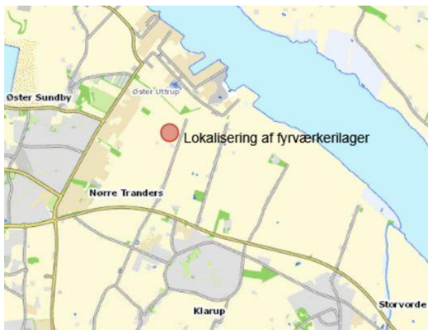
Lokalisering af det anmeldte projekt

Miljø- og Energiforvaltningen Stigsborg Brygge 5 9400 Nørresundby 9931 2050 miljoe@aalborg.dk www.aalborg.dk