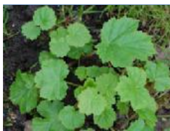
Blade af spæde planter