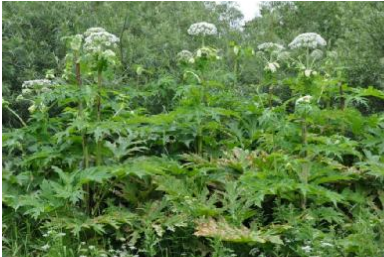
Kæmpe-Bjørneklo i blomst