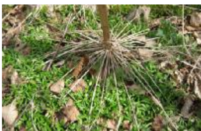
Kimplanter ved gl. blomsterskærm

Det er vigtigt at kunne kende planten i dens forskellige udviklingsstadier, for at kunne sætte ind med den mest effektive bekæmpelse.