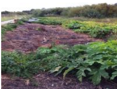
Effekt af afdækning

Omhyggelig afdækning kan næsten udrydde alle planter i løbet af en vækstsæson, men metoden kræver meget overvågning og er ikke egnet overalt. Afdækning i ét eller flere år forhindrer ikke frø i at spire de følgende år.