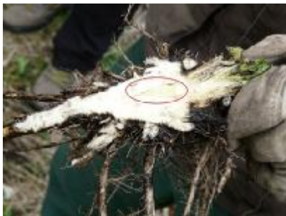
Vækstpunktet sidder under jordens overflade

Rodstikning er en effektiv bekæmpelsesmetode.