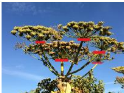
Skærmen skal kappes oppe under blomsterstanden

Ved skærmmkapning skæres blomsterne af inden frøsætning. Det forhindrer spredning af planten det enkelte år. I tætte bestande kan skærmmkapning reducere antallet af planter med tiden, da de store planter kan skygge små planter bort.