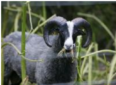
Græsning af Kæmpe-Bjørneklo

Afgræsning med får, geder og kreaturer er en effektiv metode. Heste er ikke velegnet til afgræsning af Kæmpe-Bjørneklo, da de vælger planten fra, når de græsser.