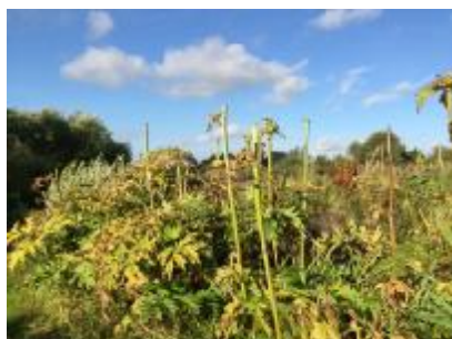
Planter med kappede skærme

Hvordan: Du skal kappe helt oppe under skærmen. Hvis stængel og blomst kappes af samlet, kan frøene modne videre på jorden alene i kraft af stængelen. Skærme med blomster og grønne, umodne frø kan efterlades, hvor de falder. Skærme med modne brune frø skal indsamles i en bunke på arealet og destrueres (afbrændes på stedet) eller samles i plastiksække og afleveres i "brændbart" på genbrugspladsen – aldrig som kompost. Skærmmkapning er en teknisk svær opgave, som kræver nærkontakt med planten, så udførelse kræver fokus på sikkerhed.