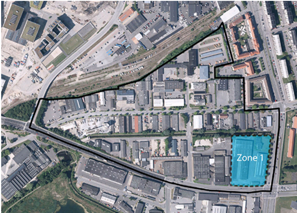
Luftfoto med zoneinddeling.

På hjørnet af Sønderbro og Østre Alle tillades byggeri i op til 7 etager for at markere gaderummet og indgangen til byen.