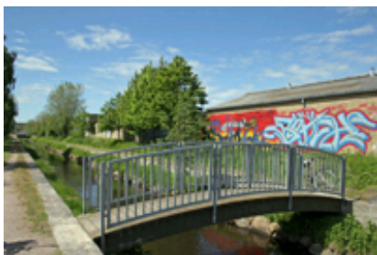
Bebyggelse langs kanalen kan med fordel gives en mere åben karakter.

Hvad angår udformning af arealerne mellem bebyggelse og veje lægges der vægt på at fastholde og forstærke grønne træk. Langs Hjulmagervej er der fx en flot og gennemført vejplantning, der kan bygges videre på i området. Herudover kan forarealer tilplantes med græs, buske og/eller grupper af træer.