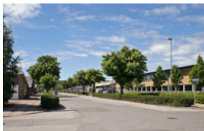
Træerne i hække langs Hjulmagervej er et fint grønt træk i området, der kan inspirere til andre dele af området.

For så vidt angår bebyggelsens udformning skal der sikres et højt arkitektonisk niveau, og