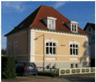
Eksempler på bedre byggeskik huse - her ses der også historicistiske og nationalromantiske træk.