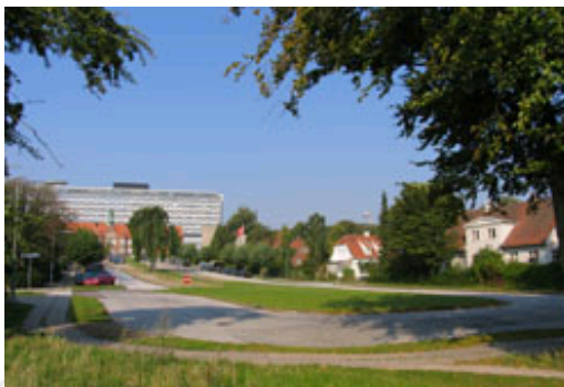
Det er hensigten at styrke den byarkitektoniske sammenhæng mellem Rømersvej og Aalborg Universitetshospital.

Der er udarbejdet stilblade for Hasseris Villaby med beskrivelse af de karakteristiske træk ved forskellige stilarter, de kan også være til inspiration for bebyggelsen i dette område. Stilbladene giver også anbefalinger til, hvordan man kan bygge om og til eller skifte bygningsdele ud, uden at gå på kompromis med stilartens formsprog.