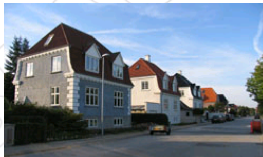
Bebyggelsen fortæller en del af historien om Aalborgs byudvikling over tid. Her ses Forchammersvej.

Der lægges særlig vægt på at sikre områdets byarkitektoniske bevaringsværdier - både i form af bebyggelse, strukturer og beplantning.