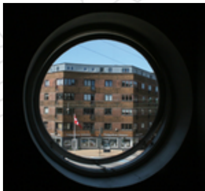
Pladsens cirkelslag i kikkerten.

Vesterbro er udpeget som kulturmiljø og arkitektonisk indsatsområde. Det er ønsket, at byrummet i dets udformning og facadebearbejdning tilføres kvaliteter, der tilgodeser intentionen om et stedsspecifikt byrum.