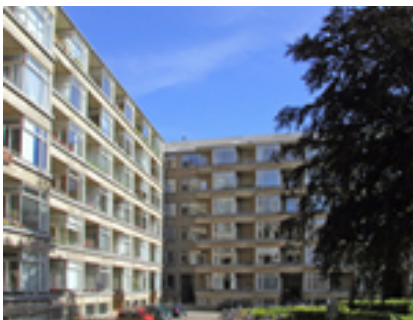
Enighedslund markerer starten på Vesterbros funkis.

En af områdets markante funkisbebyggelser, Enighedslund markerer, i samspil med den grønne byport ved Ansgars Kirken og Kildeparken, overgangen fra forstadsskalaen langs Hobrovej til den tætte by. Herfra består området dels af randbebyggelsen langs Vesterbro og de tilstødende gader, men også af en mere blandet arkitektur og bebyggelsesstruktur, der ligger mellem ovennævnte randbebyggelse og Almenkirkegården.