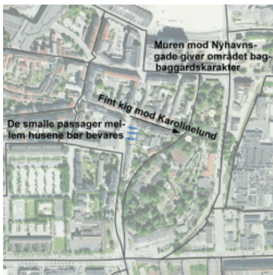
Th.ø. Områdets karakter vil styrkes med et nybyggeri, der afslutter Løkkegades bebyggelse af mod Nyhavnsgade. Th.n. Karolinelunds grønne karakter fornemmes i gaderne.

bevaringsværdige maskinal samt de flotte administrationsbygninger. Ejendommen Løkkegade 7-9, er udformet i samme stil og er i sin helhed bevaringsværdig. En tidligere vejudvidelse ved Nyhavnsgade uden genetablering af randbebyggelse får dog gadebilledet med de strittende gavle ved Løkkegade til at fremstå ufærdigt. Ligeledes giver muren mod Nyhavnsgade området et baggårdspræg, hvilket ønskes forbedret, f.eks. med etablering af ny bebyggelse.