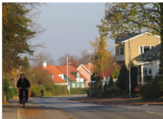
Hasserisvej har stor strukturel betydning.

Bevaringsværdien af den enkelte ejendom fremgår af retningslinie 5.2.3 . Der er udarbejdet stilblade med beskrivelse af de karakteristiske træk ved de forskellige stilarter. Stilbladene giver også anbefalinger til, hvordan man kan bygge om og til eller skifte bygningsdele ud, uden at gå på kompromis med stilartens formsprog.