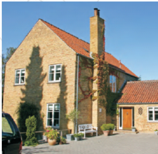
Dansk funktionel villa

Grønt areal kan ikke bebygges, se illustrationsplan