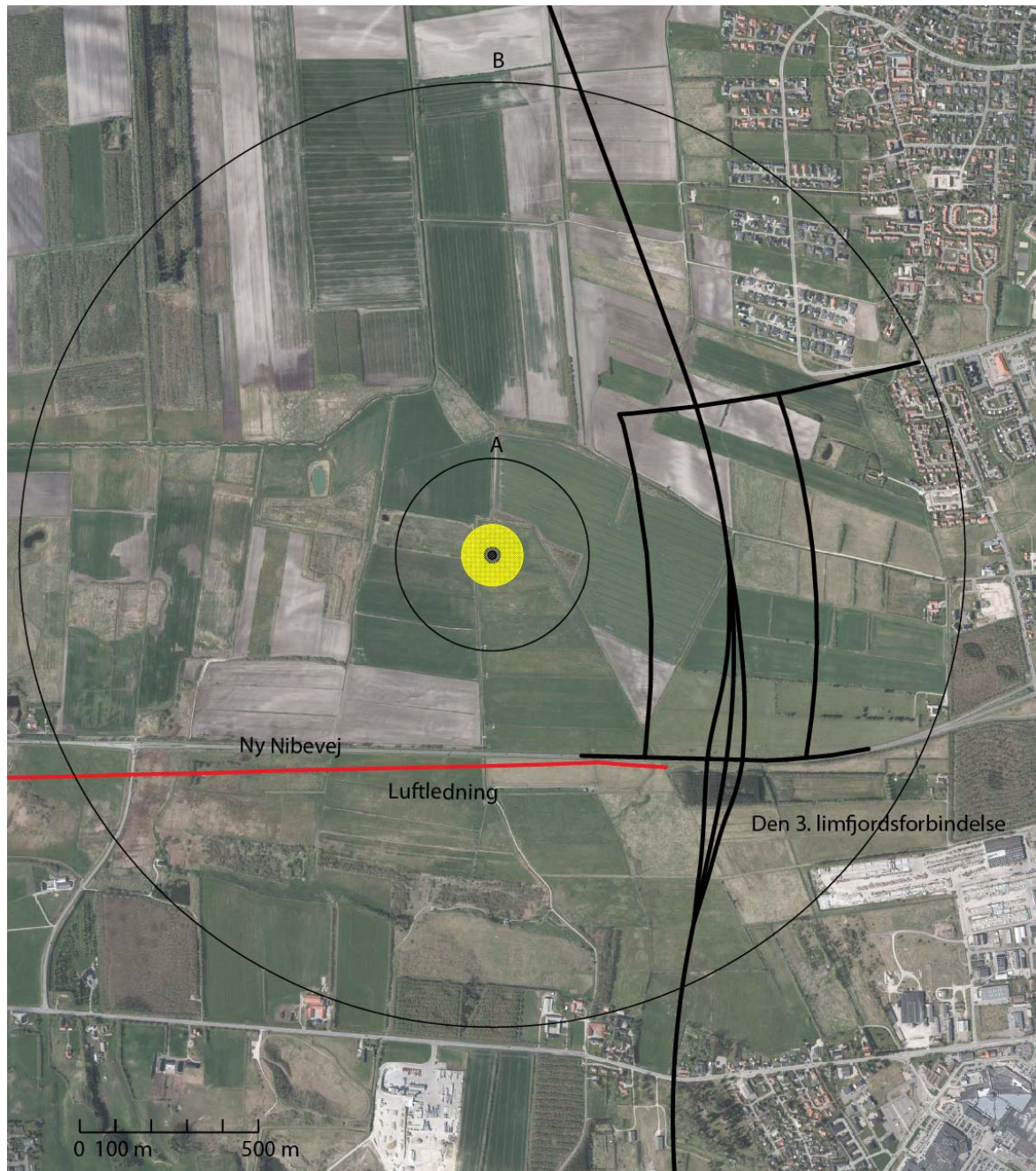
Figur 5 Heliporten med angivelse af indflyvningssektor på 360 grader (sorte cirkler om heliporten). Højden på hindringsgrænseplanet (ved de sorte cirkler) over terræn er markeret med A=19,6 m og B=150 m. En elluftledning synd for Ny Nibevej er vist med en rød linje.