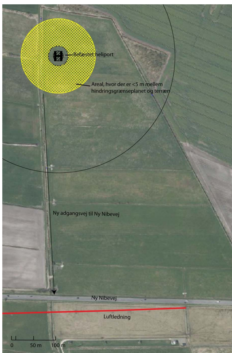
Figur 4 Placering af heliport ved Ny Nibevej (Nord). Luftledningen vist med kortet med en rød linje. Adgangsvejen til Ny Nibevej går ad en eksisterende markvej, som tilsluttes Ny Nibevej i en ny overkørsel. Der vil være ca. 550 m grusvej fra heliporten til udkørslen til Ny Nibevej.

Ca. 22 m syd for Ny Nibevej ligger en øst-vest gående elluftledning. Himmerlands Elforsyning har d. 23-10-2013 oplyst, at elluftledningen har en højde på ca. 5-6 m, og at der skal tillægges en respektafstand til ledningen på 6 meter over og ved siden af.