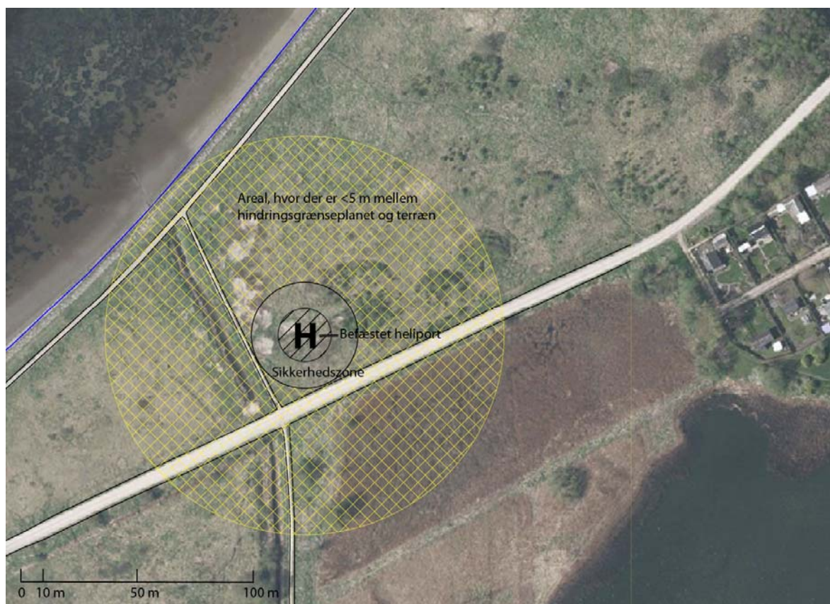
Figur 1 - Placering af heliporten vest for Renseanlæg Vest i Aalborg. Der vil være ca. 300 m grusvej fra heliporten til indgangsporten til Renseanlæg Vest på Mølholmsvej.

Centrum af heliporten ved Renseanlæg Vest er placeret ved koordinat: 552119.2138, 6322947.4863 (koordinatsystem: Euref 89).