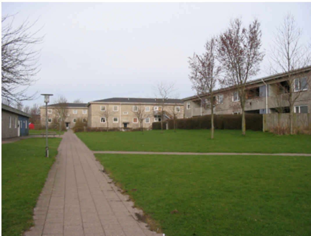
De grønne områder er integreret i bebyggelsen.