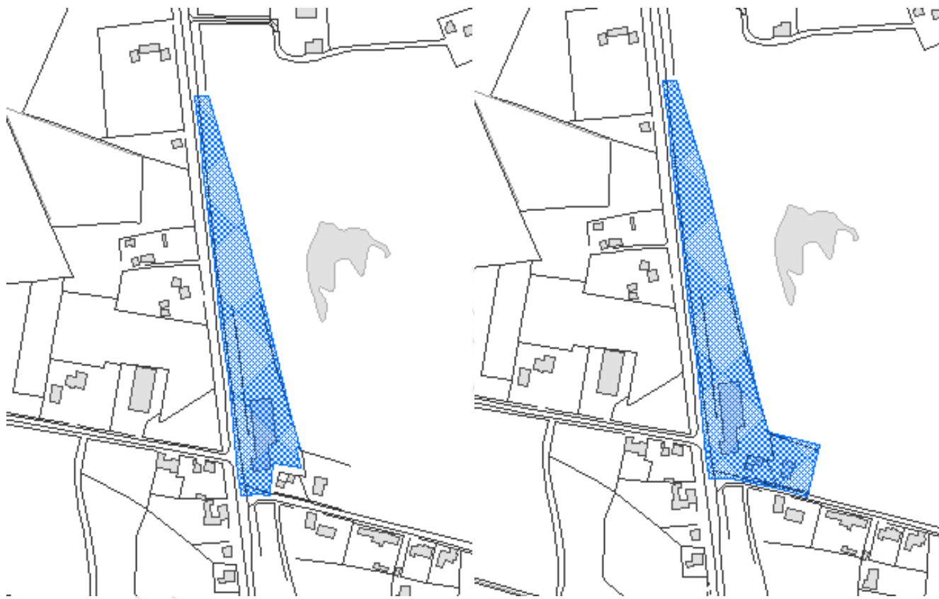
Gældende område til "Særlig pladskrævende varer".