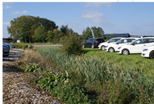
Grøft Bilgården Hostrup.

Planerne omfatter ikke projekter eller anlæg opført på bilag 1 eller bilag 2 i ovennævnte bekendtgørelse. Derfor skal der ikke udarbejdes en VVM-screening eller en VVM-redegørelse.