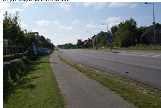
Bilgården Hostrup set fra Sulsted Landevej.