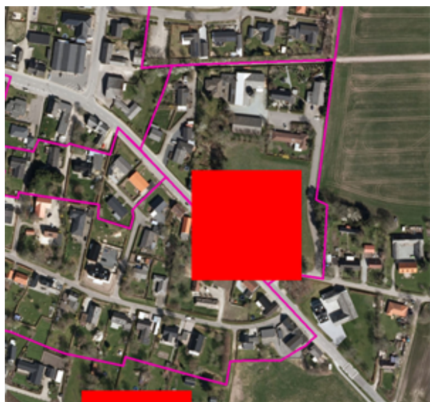
Høj risiko for oversvømmelse (røde områder)

I henhold til kommuneplanens retningslinje 2.1.6 Byudvikling, byomdannelse og klimatilpasning skal der i lokalplaner i områder med høj risiko for oversvømmelse (defineret som en risiko på 5% eller mere for oversvømmelse i 2050) redegøres for klimatilpasningstiltag. Aalborg Kommune har screenet hele kommunen for overfladevand med udgangspunkt i de forventede klimaforhold i 2050. Der er således sandsynlighed for, at den sydøstlige del af rammeområdet vil få tilført mere vand i fremtiden i forbindelse med fx stigende grundvandsspejl og skybrudshændelser. Det er op til ejeren og bygherrer selv at få vurderet risikoens omfang, herunder om der skal gennemføres foranstaltninger i forbindelse med bygge- og anlægsarbejder for at imødegå evt. oversvømmelser.