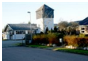
Erhverv, Poul Smeds Vej

Området er oprindeligt opstået som et kombineret bolig- og erhvervsområde i 1960'erne og 1970'erne, og har tidligere rummet en produktionsskole og andre mindre erhverv. I dag anvendes hovedparten af området til boligformål, men der er flere