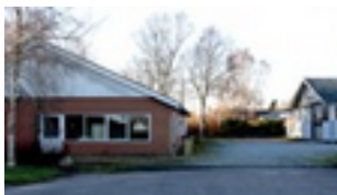
Erhverv, Poul Smeds Vej

Planlægningen skal sikre tilfredsstillende trafikbetjening, miljøforhold, høring af berørte parter mv.