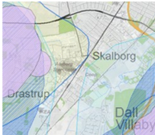
Interesseområder for vandindvinding. Den lilla farve viser kildepladszoner, den mørkeblå skravering angiver områder med særlige drikkevandsinteresser (OSD), den lyse blå skravering angiver områder med drikkevandsinteresser (OD) og den gule skravering med blå kant angiver indvindingsoplandet til den enkelte kildeplads.