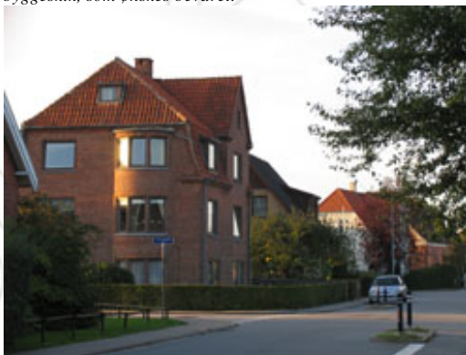
Der lægges vægt på at bevare "Kærbyhusenes" særlige karaktertræk: højtliggende kældre, høj trappe ved entrédøren, røde mursten, tegltage og afvalmede gavle.