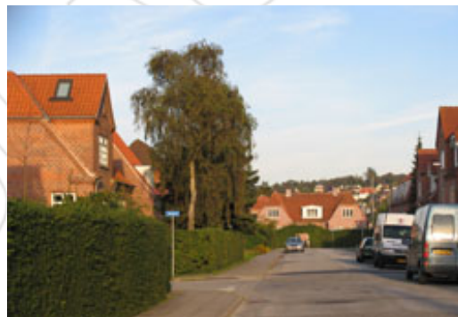
Kvarterets grønne præg og karakteristiske byggeskik skal sikres.

Målet er at udvikle Kærby som et attraktivt centrumnært boligkvarter. Det specielle ved kvarteret skal sikres ved at lægge vægt på et markant grønt præg, samt at synliggøre Østerå og Vestre Landgrøft som grønne træk og videreføre den særlige byggeskik i "Kærbyhusene".