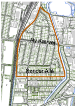
Den ældste del af Kærby fra Sønder Alle mod syd til det tidligere banespor mod nord - rummer en karakteristisk byggeskik, som ønskes bevaret.