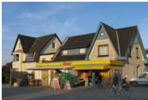
Butikker kan medvirke til en større bymæssighed langs Ny Kærvej og Enggårdsgade.

Der lægges vægt på, at området fremstår med et grønt og åbent præg. Hensigten er at synliggøre naturen og ådalen som et væsentligt landskabeligt træk i byen.