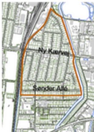
Den ældste del af Kærby fra Sønder Alle mod syd til det tidligere banespor mod nord - rummer en karakteristisk byggeskik, som ønskes bevaret.