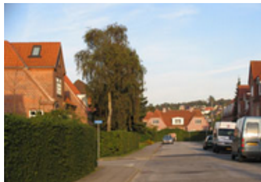
Kvarterets grønne præg og karakteristiske byggeskik skal sikres.

Målet er at udvikle Kærby som et attraktivt centrumnært boligkvarter. Det specielle ved kvarteret skal sikres ved at lægge vægt på et markant grønt præg, samt at synliggøre Østerå og Vestre Landgrøft som grønne træk og videreføre den særlige byggeskik i "Kærbyhusene".