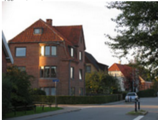
Der lægges vægt på at bevare "Kærbyhusenes" særlige karaktertræk: højtliggende kældre, høj trappe ved entrédøren, røde mursten, tegltage og afvalmede gavle.