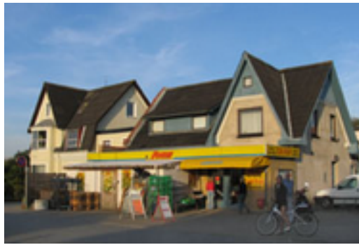
Butikker kan medvirke til en større bymæssighed langs Ny Kærvej og Enggårdsgade.

Der lægges vægt på, at området fremstår med et grønt og åbent præg. Hensigten er at synliggøre naturen og ådalen som et væsentligt landskabeligt træk i byen.