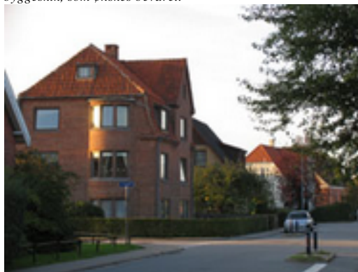
Der lægges vægt på at bevare "Kærbyhusenes" særlige karaktertræk: højtliggende kældre, høj trappe ved entrédøren, røde mursten, tegltage og afvalmede gavle.