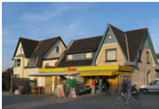
Butikker kan medvirke til en større bymæssighed langs Ny Kærvej og Enggårdsgade.

Der lægges vægt på, at området fremstår med et grønt og åbent præg. Hensigten er at synliggøre naturen og ådalen som et væsentligt landskabeligt træk i byen.