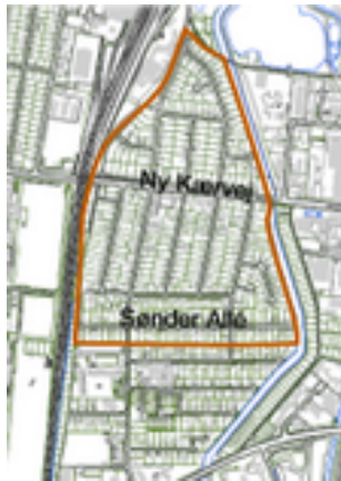
Den ældste del af Kærby fra Sønder Alle mod syd til det tidligere banespor mod nord - rummer en karakteristisk byggeskik, som ønskes bevaret.