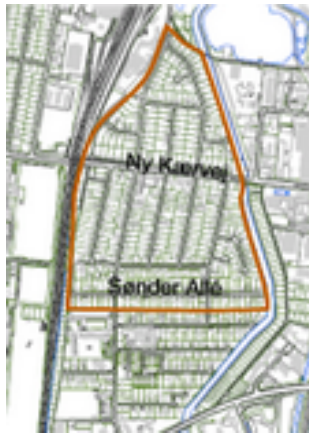
Den ældste del af Kærby fra Sønder Alle mod syd til det tidligere banespor mod nord - rummer en karakteristisk byggeskik, som ønskes bevaret.