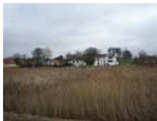
Nibe Strandpark ligger ud til strandensarealet ved Aalborgvej

Området er et lavtliggende boligområde, der udgør en del af bykanten mod fjorden og som i kraft heraf har en attraktiv beliggenhed. Det er målet at udvikle området til et attraktivt område med åben/lav, tæt/lav eller etageboliger i op til 2 etager.