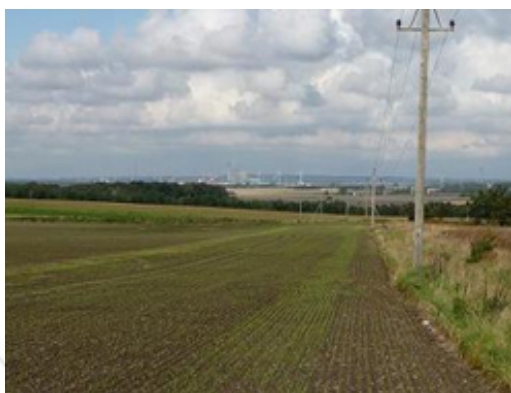
Udsigt ind mod Aalborg