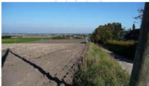
Området, hvor byudviklingen skal foregå, er i dag bar mark

En kommende lokalplan for området skal ligeledes sikre, at en fremtidig bebyggelse skal tilpasses de særlige kulturværdier, der findes ved Sejflod Kirke, og sikre indsiget til og udsyn fra kirken.