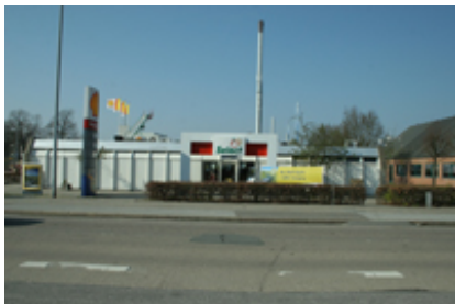
Benzinstationen har fået en central placering i bybilledet, der forpligter.

Området primært benzinstationen har med forlægningen af Karolinelundsvej fået en meget synlig placering i bybilledet, hvilket stiller krav til såvel arkitektur og skiltning som udearealernes fremtoning.