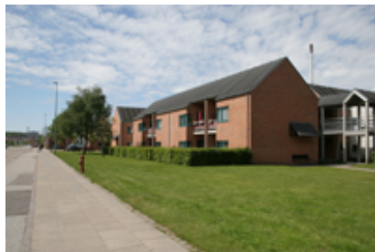
Ældrecentret fremstår som en sluttet enklave mod Fyensgade.