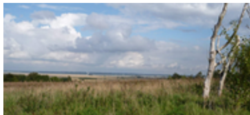
Rekreativt område med udsigt til Limfjorden

Området er et stort sammenhængende areal (ca. 20 ha), og der bør derfor udarbejdes en samlet plan for udbygning af området sammen med det udlagte perspektivområde vest for