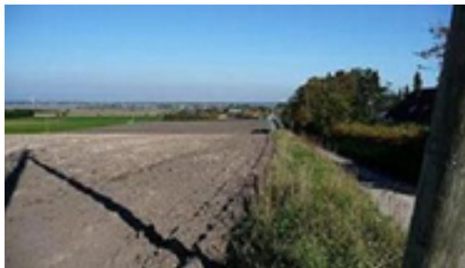
Området, hvor byudviklingen skal foregå, er i dag bar mark

En kommende lokalplan for området skal ligeledes sikre, at en fremtidig bebyggelse skal tilpasses de særlige kulturværdier, der findes ved Sejflod Kirke, og sikre indsigts til og udsyn fra kirken.