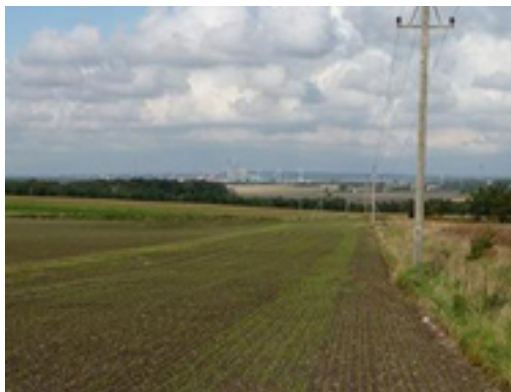
Udsigt ind mod Aalborg