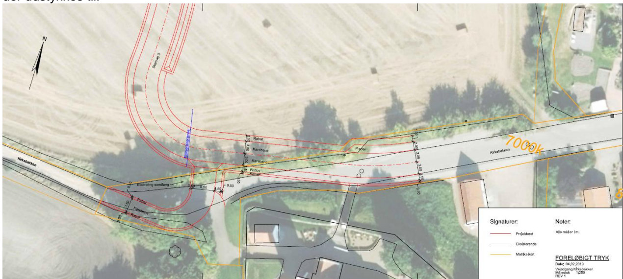
Figur 3 Skitsetegning/udsnit af tilslutning af byggemodning til Kirkebakken

Når projektet er færdigudbygget, vil der komme ekstra trafik på vejanlægget. Men da byggemodningen ikke har en gennemgående vej vil der kun komme en ekstra trafik fra de parceller der udstykkes til.