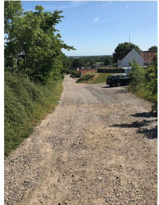
Figur 2 eksisterende forhold på Kirkebakken

Det vurderes at den primære destination for trafikken på den øverste del af Kirkebakken er til og fra kirken samt til de enkelte ovenliggende grunde.