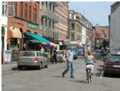
Reberbansgade summer af aktivitet.

Et andet helstøbt gaderum, der skal fremhæves er Dalgasgade, som med facadernes smukke reliefvirkning har en stærk oplevelse af perspektiv og tæthed. Bygningerne er velproportionerede med korte facader, samt et detaljeringsniveau og farvespil, der giver en god rytme og variation i gaden.