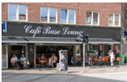
Udeservering ved Vesterbro.