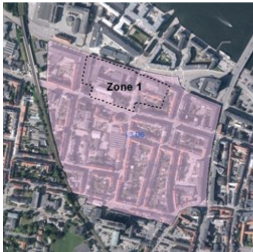
Luftfoto med zoneinddeling (se byggemuligheder i højre spalte)

Området anses som værende fuldt udbygget, med mulighed for byfortætning enkelte steder. Ny bebyggelse kan opføres som tilbygninger, udfyldnings- eller erstatningsbyggeri, hvor der er tale om stærkt nedslidte eller utilpassede bygninger uden særlig bevaringsværdi, eller hvor helheden vurderes at kunne styrkes ved til- om- eller nybygning.