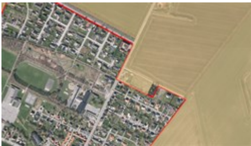
Gældende retningslinje for øvrige landområder