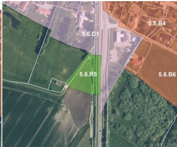
Afgrænsning af de gældende rammeområder