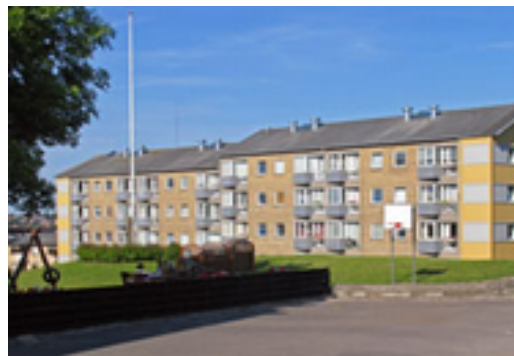
Etageboliger med store fælles friarealer.

Kvaliteten af boliger og opholdsarealer er i højsædet. Udviklingen skal tage afsæt i de rummelige friarealer, der skal udnyttes som et aktiv for området.