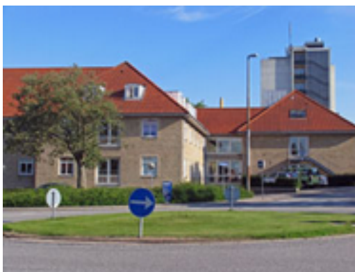
Riishøjscentret med plejehjem, aktivitetscenter, undervisning m.m.

Forud for placering af institutioner med mere end 10 beboere og 4 ansatte samt andre funktioner, som vurderes at kunne medføre betydelig genevirkning, skal der gennemføres en lokalplanlægning.