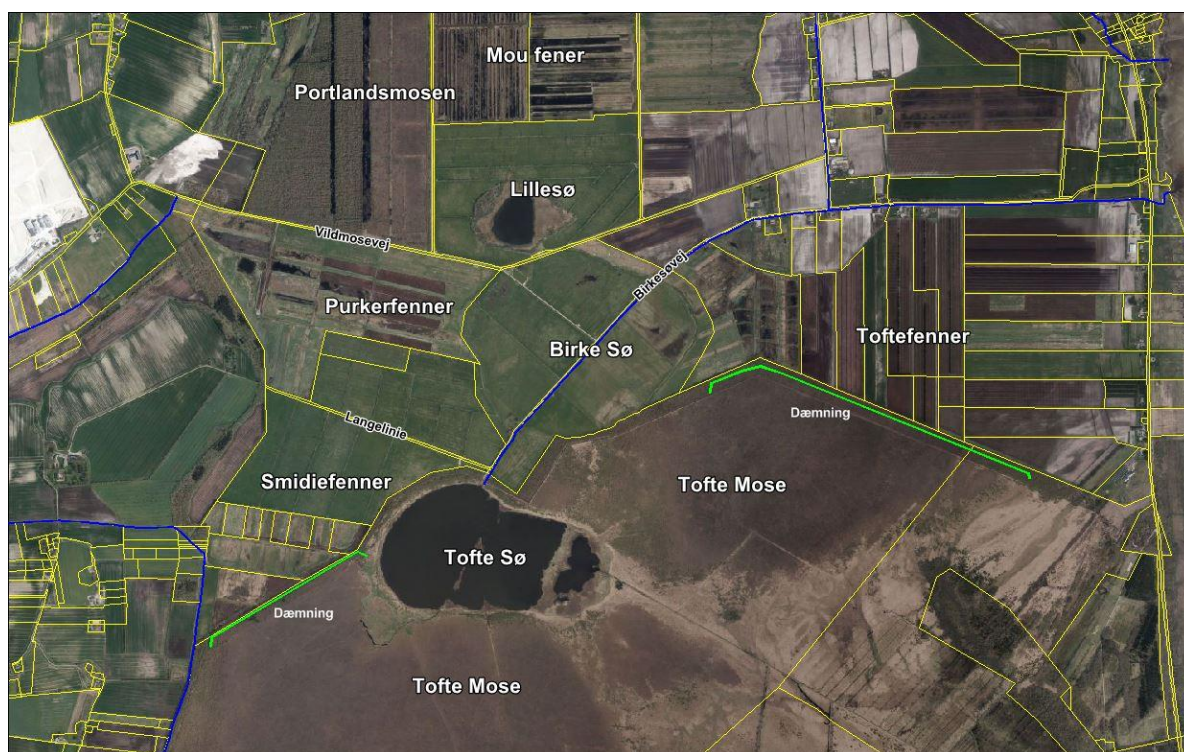
Figur 1 Oversigtstegning

Smidie Fenner og de omkringliggende områder udgør en del af Natura 2000 område nr. 17 " Lille Vildmose, Tofte Skov og Høstemark Skov", området afvander endvidere til Natura 2000 område nr. 14 " Ålborg Bugt, Randers Fjord og Mariager Fjord". I forbindelse med forundersøgelserne er der lavet en VVM-redegørelse der bl.a. beskriver konsekvenserne for natura 2000 området.